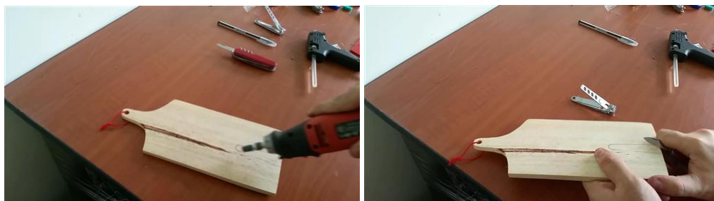
Rebaje de la zona donde se colocará el cortaúñas.