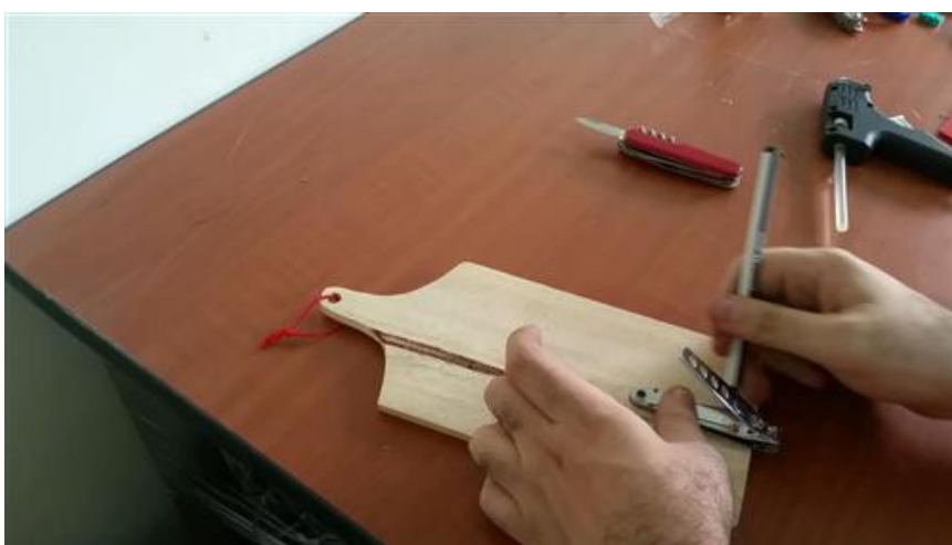
Marcación de la zona donde se colocará el cortaúñas.