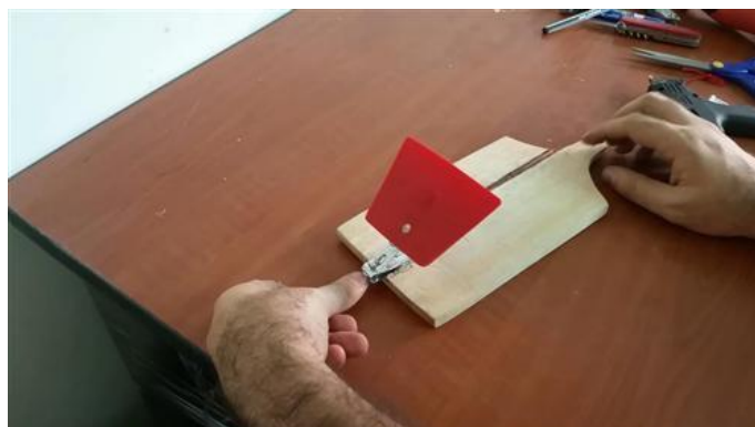
Pegado de la pletina de plástico a la palanca del cortaúñas.