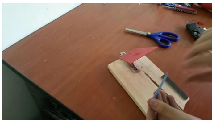
Colocación de las limas.