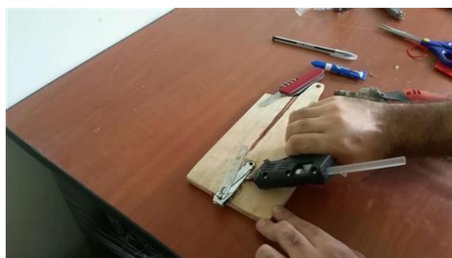
Pegado del cortaúñas a la zona rebajada.