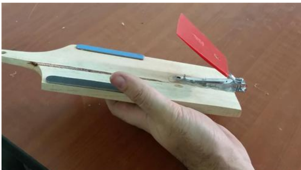
La adaptación acabada.