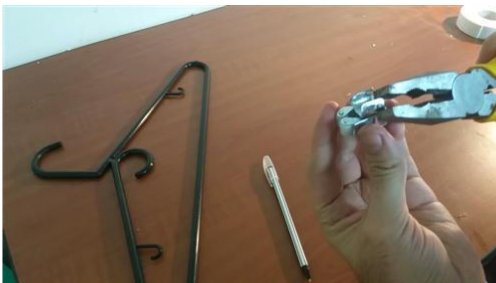
Conformación del clip para sujetar la varilla.