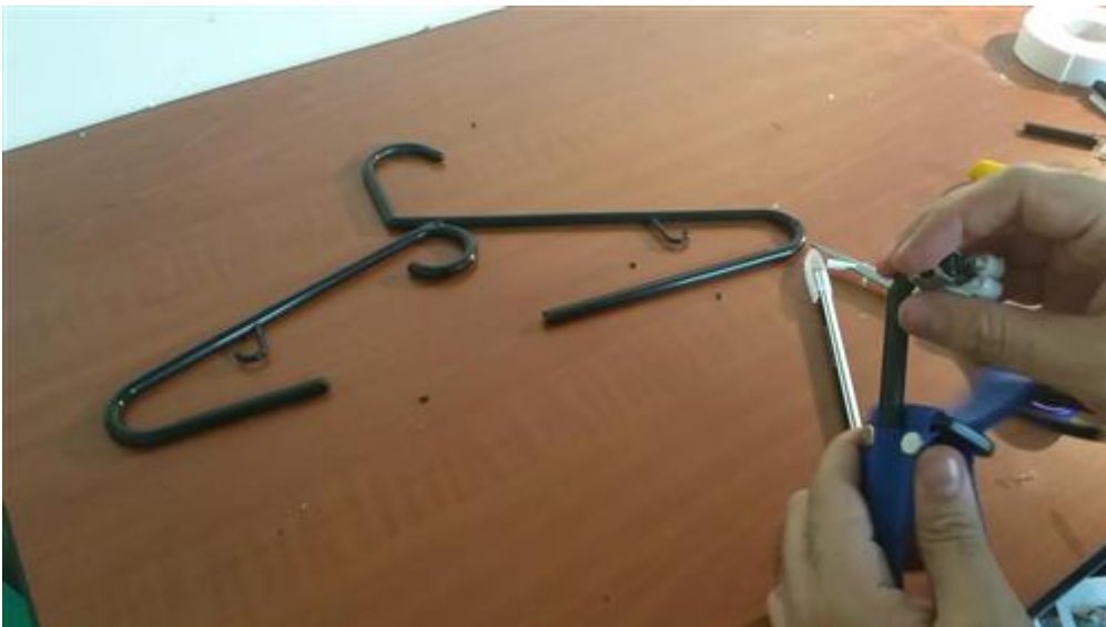
Inserción de la varilla en la cinta de muñeca.