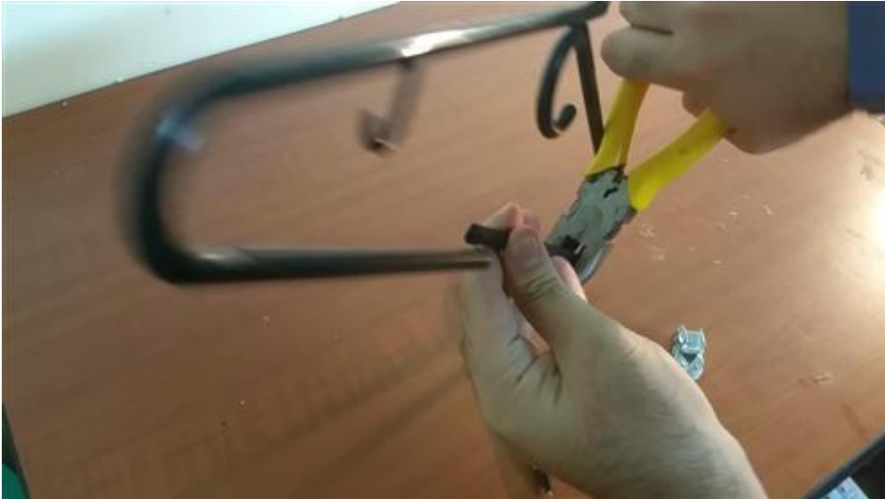
Recortado de la varilla.