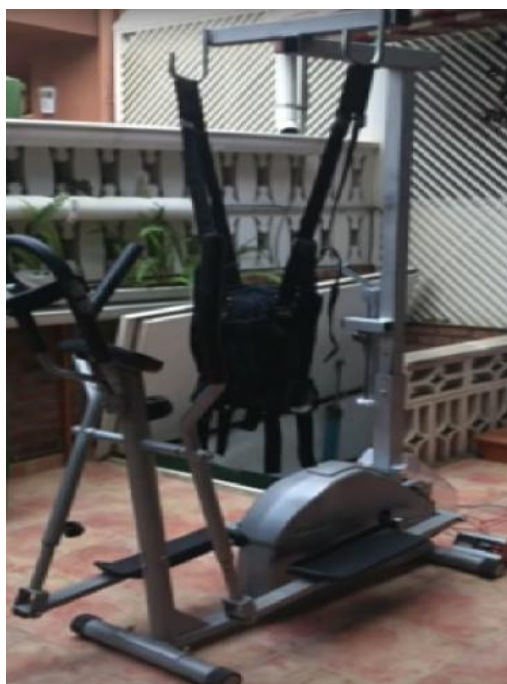
Poner el arnés en los ganchos y montar al niño.