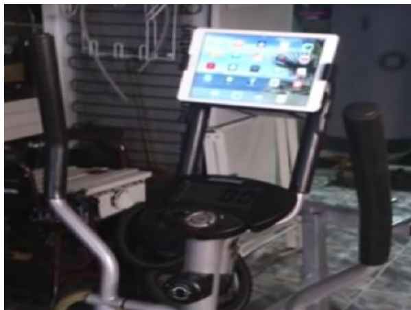
Montamos un soporte para Ipad.