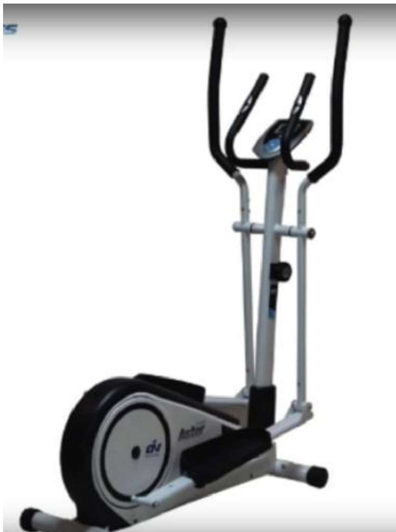
Partimos de una máquina elíptica estándar

Video tutorial en YouTube: https://www.youtube.com/watch?v=1TII-o8C-7w