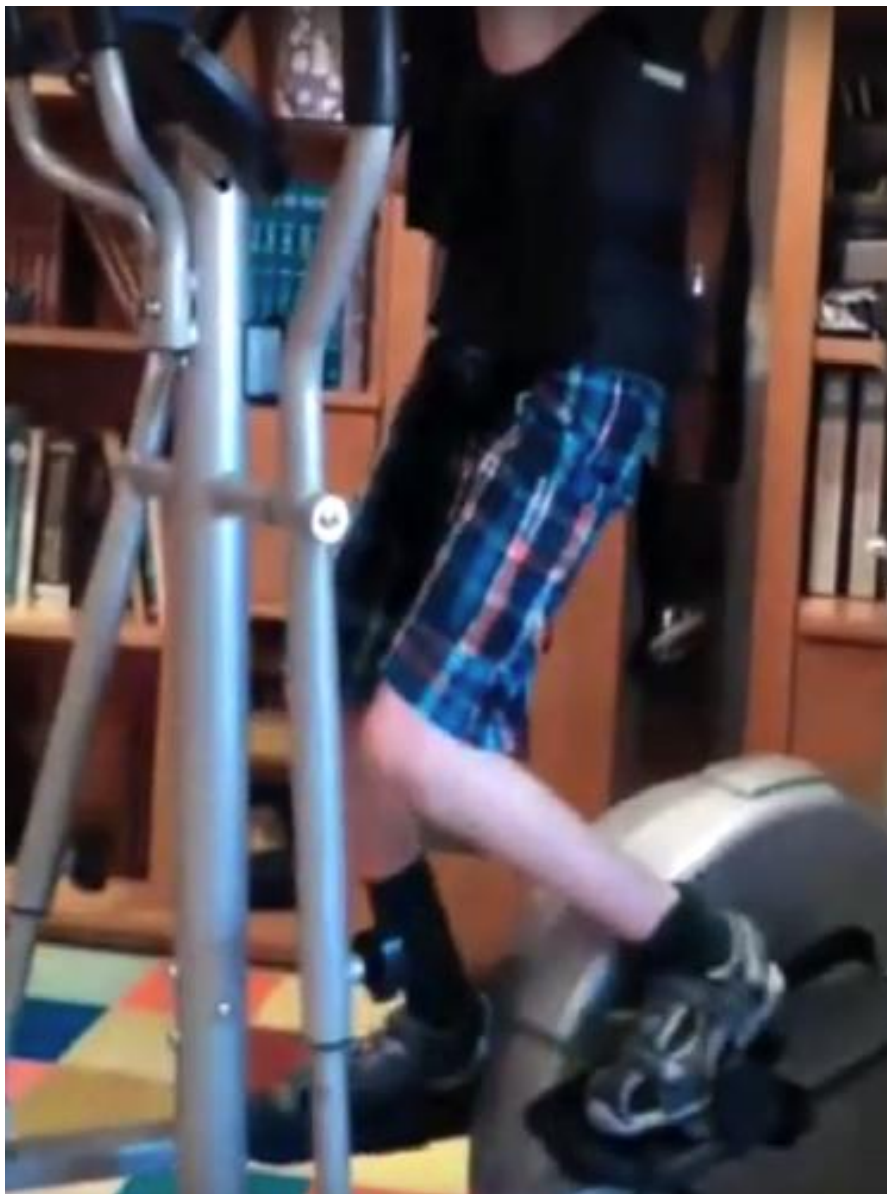
Montar al niño y ajustar la altura hasta tener un buen de rodillas.