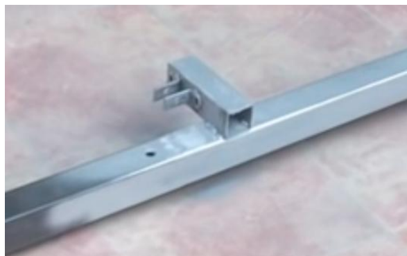
Soporte para sujeción del gato de coche.