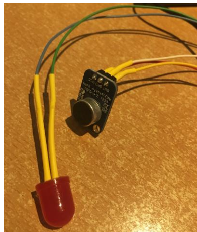
Imagen del micrófono y led utilizado en la adaptación.