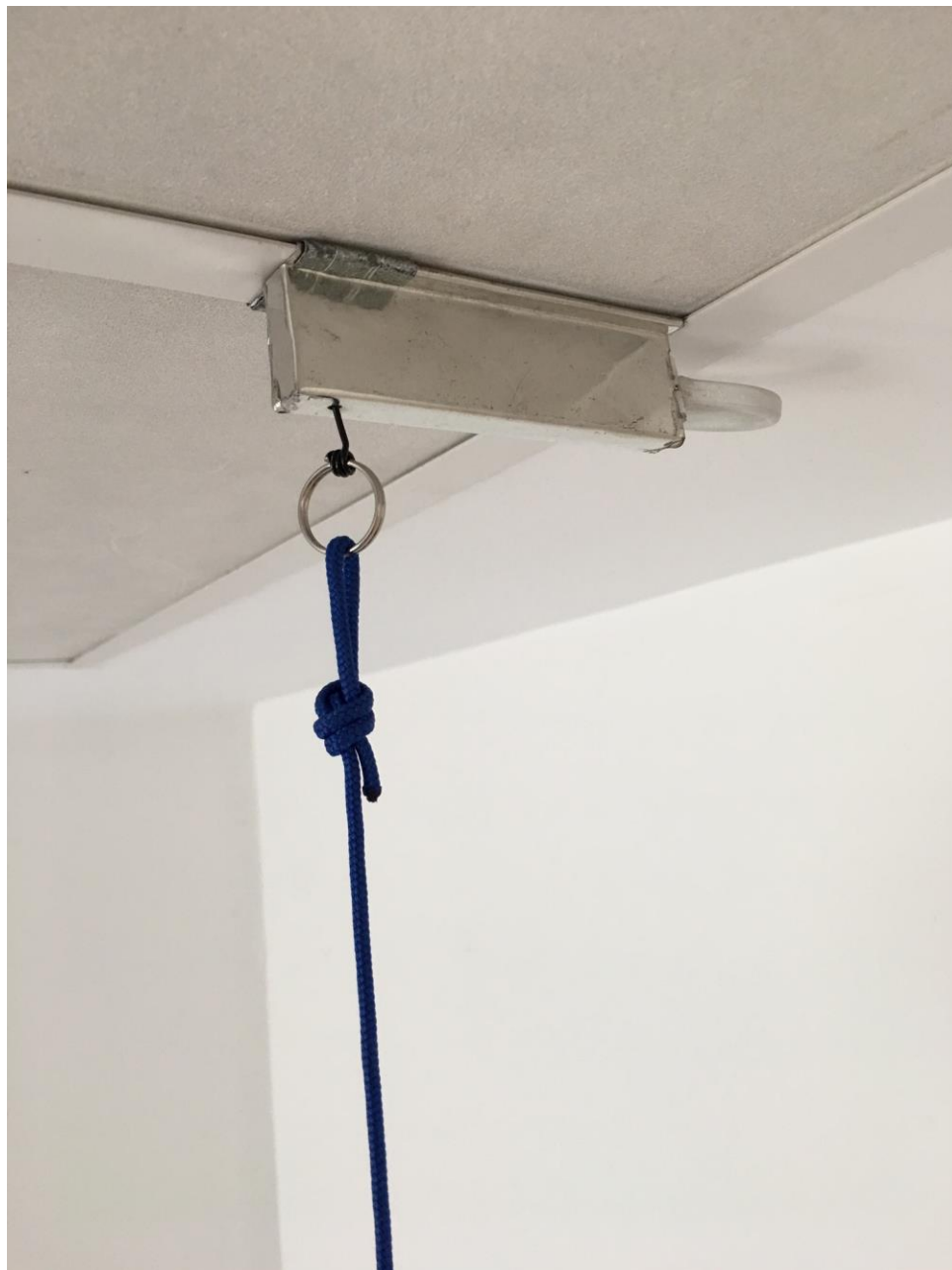
Se fija la guía y se lleva el cable hasta el conector del llamador.