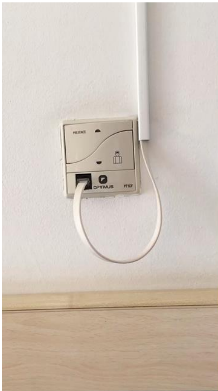
Se conecta y listo.