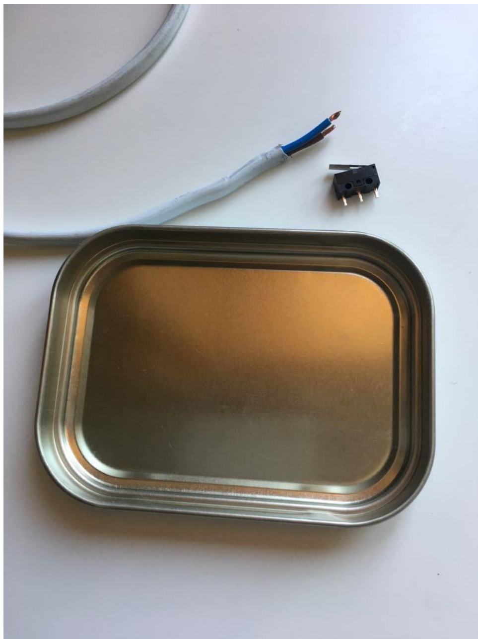
Materiales necesarios para el llamador.